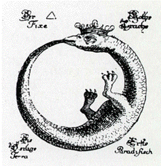
Uroboros - had požírající vlastní ocas